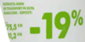
NOTAȚIA NEGRĂ: EMISIILE DE CO2 PE RUTA MAGAZIN - DEPOZIT

Deși pe am depășit depozitul de la Lugoj. În noiembrie 2016, numărul de kilometri parcurși s-a redus, iar consumul de combustibil a scăzut cu 19%. Distanța medie de transport pe ruta magazin - depozit s-a redus la 343,3 km, față de 413,5 km distanță parcurși înainte de deschiderea depozitului.